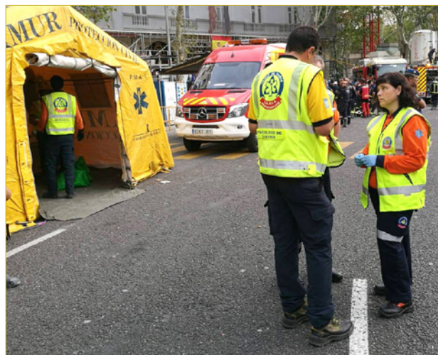
FIGURA 1. La coordinación de los intervinientes es fundamental desde la fase de planificación y siempre mejorará la atención al paciente.

Por otro lado, hay que desterrar los mitos sobre la materia, dado que nos pueden llevar a sacar conclusiones erróneas. El más grave e importante, aquel que dice que los que amenazan con el suicidio solo quieren llamar la atención, pues la verdad es que las personas que amenazan con suicidarse,