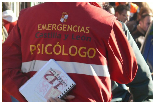
FIGURA 2. La incorporación de psicólogos a los perfiles de respuesta a incidentes con pacientes suicidas tiene por objetivo mejorar la atención a los pacientes.

en la mayoría de los casos, lo hacen. Esa idea generalizada de que el que avisa solo pretende llamar la atención y creer que el paciente no está hablando en serio es extremadamente peligroso, porque provoca que los intervinientes no tomen en serio a la persona/paciente. El que avisa, probablemente acabe quitándose la vida, así que hay que tenerlo muy presente. Otros mitos generalizados son que la luna llena afecta a las personas que quieren quitarse la vida y que hay más intervenciones con pacientes que sufren algún tipo de trastorno mental o que el viento también provoca más casos de este tipo. Todas ellas son falsas también. Todos los estudios consultados indican que no les afecta. Y un último mito que puede generar problemas legales, es el de que el intento de suicidio es delito. No lo es. El único delito relacionado con el suicidio en España es el de inducción al suicidio, que es el que se podría incurrir si se anima al suicida a cometer los actos encaminados a quitarse la vida: «venga, salta ya que llevamos aquí todo el día» o similares, especialmente si se cree que la persona no está hablando en serio. Este tipo de hechos han sucedido y han acabado en